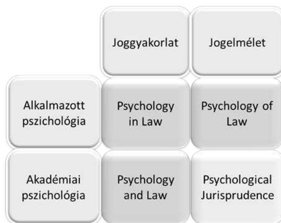
5. ábra: pszichológiai jogelmélet helye a Haney féle rendszertanban

Meglátásom szerint ebben csak egy pszichológiai jogelméleti irányzat hozhatna megoldást, melynek eddigi eredményei a disszertáció II. részében kerülnek bemutatásra.