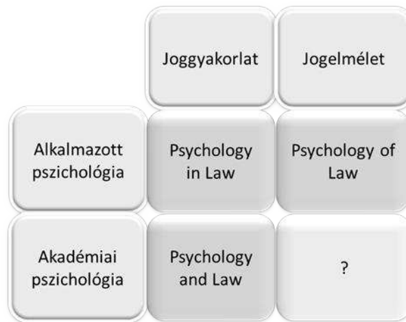
2. ábra: jog és pszichológia kapcsolódási pontjai mátrix elrendezésben

Ha Haney hármassal a fenti táblázatos megjelenítés helyett a 2. ábrán látható mátrixba helyezzük, amely mátrixnak a felső sorában a joggyakorlat és a jogelmélet területeit, oldalsó oszlopába pedig a pszichológia alkalmazott és elméleti területét tesszük, akkor rögtön kitűnik az a hiány, amit James Ogloff a pszichológia és jog közös elméleti megalapozásának nevez 2002-es összefoglaló könyvében.