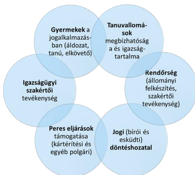
4. ábra: alkalmazott és elméleti jogpszichológiai területek kapcsolódása

igazságügyi szakértői gyakorlaton keresztül, mára a joggyakorlat integráns részévé váltak. A korai jogpszichológiai rendszertan még alkalmazási területek alapján közelített a jogpszichológiához és teljesen figyelmen kívül hagyta a terület elméleti megalapozásának szükségszerűségét. Ha megint rápillantunk Haney rendszerére alapján készített mátrix elrendezésére a 2. ábrán, akkor látható, hogy a korábbi üres négyzetbe pompásan beleillene a pszichológiai jogelmélet koncepciója. Ez a megalapozás azért is időszerű, mert a gyakorlati vagy alkalmazott területek felől való megközelítés az egyre szaporodó tudományos adatok birtokában kezd egyre szerteágzóbbá válni. A 4. ábra a főbb gyakorlati alkalmazási területek összekapcsolódásait hivatott mutatni, azonban szinte minden egyes területnek lehetne közös metszete mindegyik más területtel.